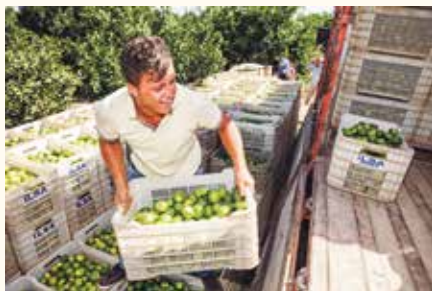
Турция производит и экспортирует цитрусовую продукцию высшего качества

Безопасные продукты – это прежде всего не наносящие вреда здоровью человека, не содержащие следов пестицидов и химических удобрений продукты, процесс производства которых отличается прозрачностью и стабильностью. Современный потребитель хорошо осведомлен в вопросах безопасности продуктов и желает знать, какие стадии обработки проходит тот или иной товар. Принципы надлежащей сельскохозяйственной практики (GAP) помогают систематизировать данную информацию согласно мировым стандартам. Международный протокол GLOBALGAP обеспечивает соблюдение всеми произво-